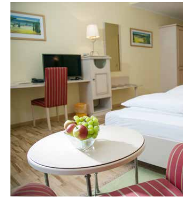
Gemütliche, entspannte Atmosphäre

Der Dreiklang von Heilklima, Heilwasser und Ruhe bietet in familiärer Atmosphäre die ideale Voraussetzung für eine erfolgreiche Kur. Durch das gemütliche Ambiente mit viel Holz fühlt man sich bei uns vom ersten Augenblick an Zuhause.